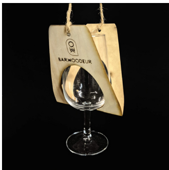
Porte verre à graver - PVG