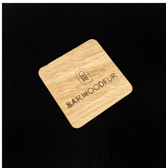
Sous-verre en chêne - SVC