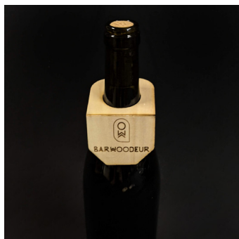
Etiquette - ET