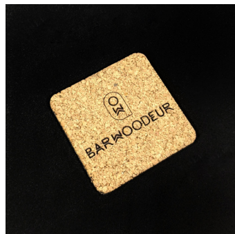
Sous-verre en liège - SVL