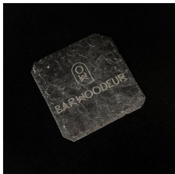
Sous-verre en ardoise - SVA