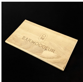
Planche à découper - PAD