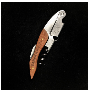
Tire bouchon sommelier - TBS