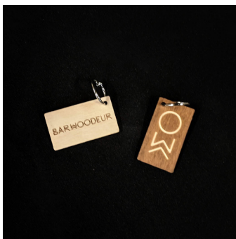
Porte clés - PC