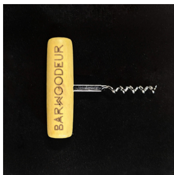
Tire bouchon - TB