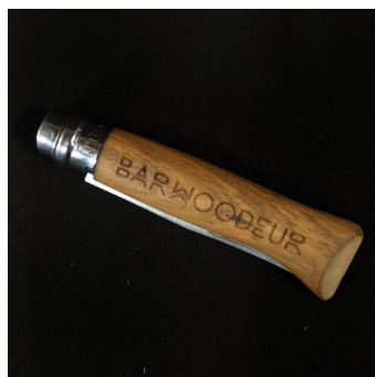
Opinel n°8 - OP8