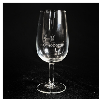
Verre INAO personnalisé - VP