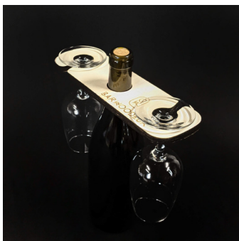
Présentoir 2 verres - P2V