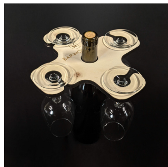
Présentoir 4 verres - P4V