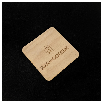
Sous-verre en hêtre - SVH